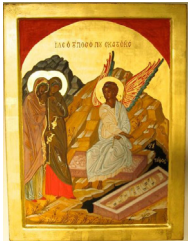
Ikone: Bruder Elia, Latrun